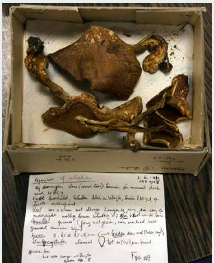
Paddenstoelen uit de van Zanen-collectie