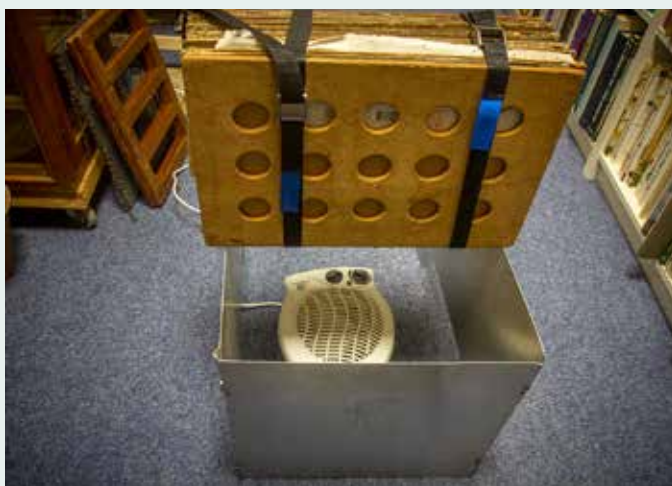
Boven: een deel van de collectie Links: het drogen van planten in de plantenpers

bijzondere vondsten hebben floristen altijd materiaal verzameld. Verder moet je geen zeldzame planten willen plukken en geen planten waarvan er maar heel weinig van staan. Daar geven we ook informatie over. Als je eenmaal een plant geplukt hebt, dan moet je er ook zorgvuldig mee omgaan. Anders kun je beter een foto maken. Op onze website staan tips hoe je het beste kunt drogen zodat je ook mooi materiaal krijgt. Dat getuigt van respect voor de plant.