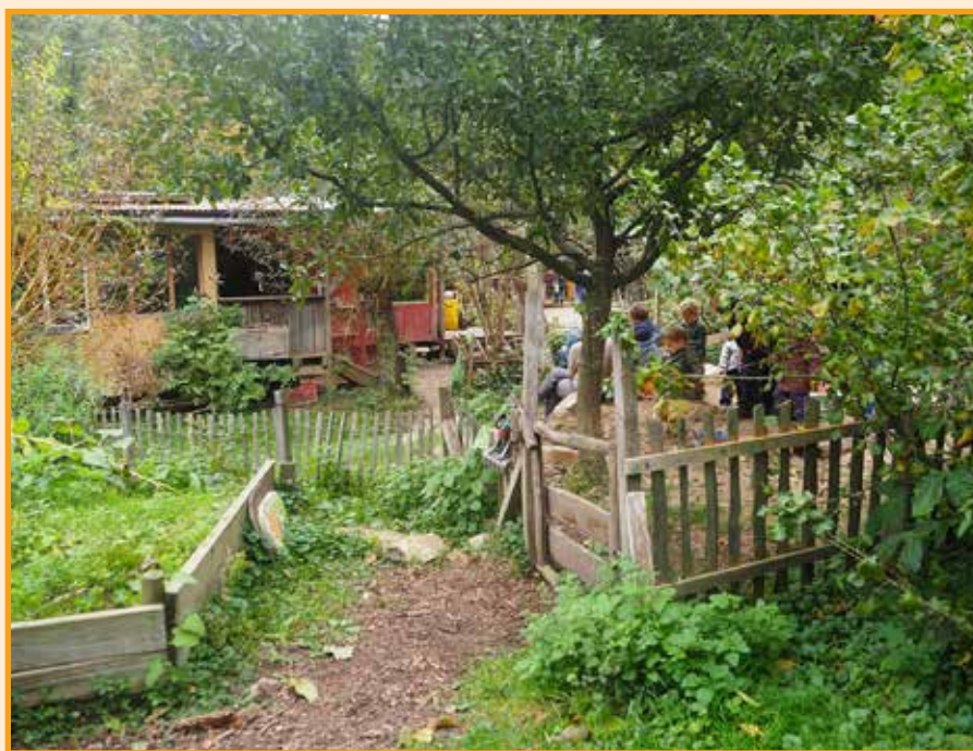
Naturkindergarten Waldwiesel op het terrein van het Kinderabenteuerhof Freiburg

kunnen laten zien van deze speel-landschappen. Wat het betekent voor hun ontwikkeling, persoonlijke vorming, welbevinden en hun