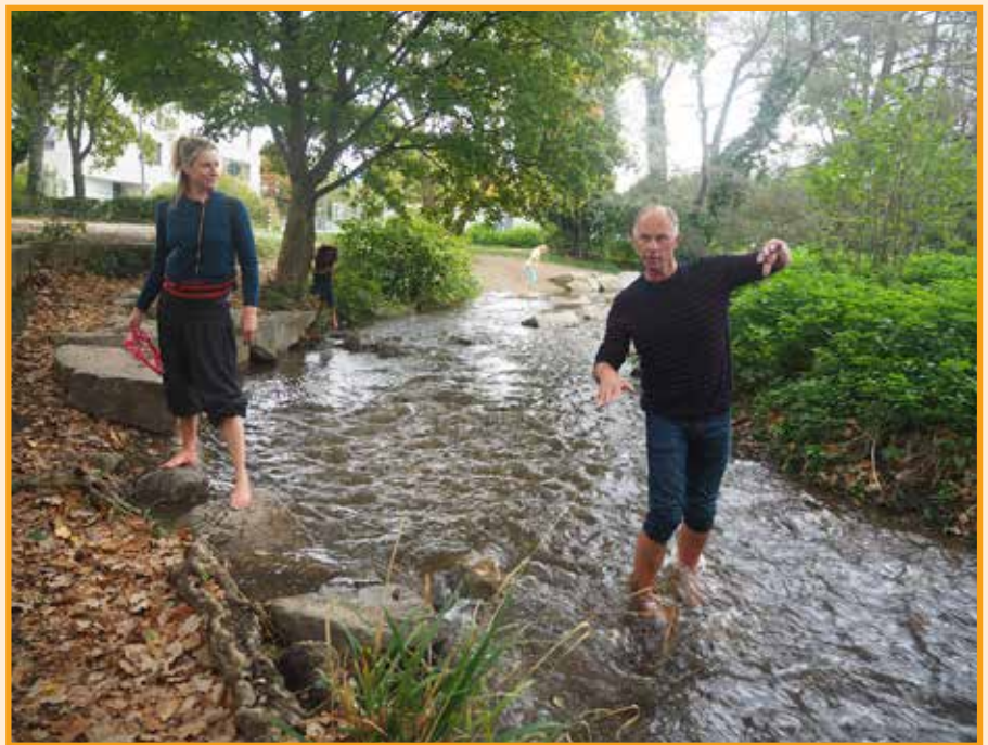
Speelplekken zelf ervaren werkt natuurlijk nog beter dan bekijken

'Als je je herinnert wie je bent, zal je stoppen jezelf te haten voor wat je vreest te zijn.'