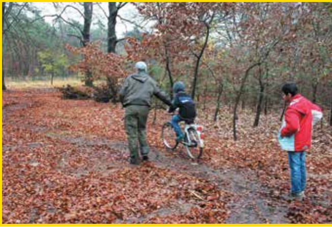
Anneke Rodenburg heeft het fietsparcours uitgezet en test het met de kinderen