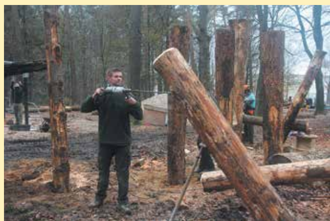
Het klimparcours wordt door 'de Twee Heren' gebouwd ↑