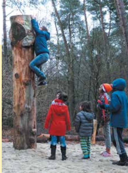
Alles wordt meteen uitgeprobeerd →