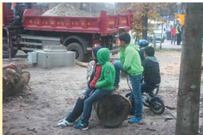
↑ Wat gaat er gebeuren?